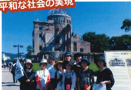
ヒロシマ・ナガサキ平和の旅