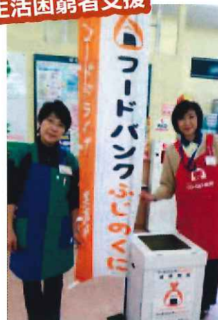
店舗でのフードバンク活動