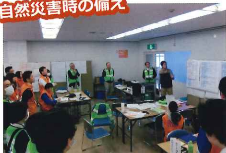
災害ボランティア図上訓練への参加